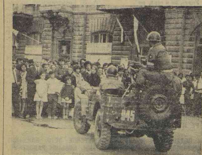
Кадр из фильма «Ночь над Чили». Киностудия «Мосфильм», режиссеры С. Аларион и А. Юсупов.